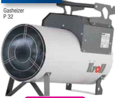
Gasheizer P 32